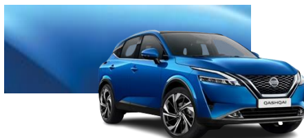
Niebieski - RCF