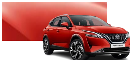
Czerwony Fuji Sunset - NBV