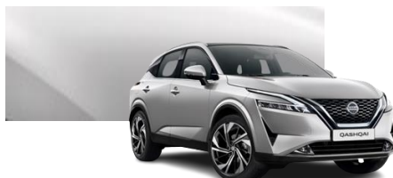
Srebrny - KY0