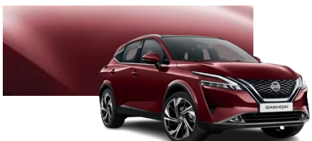
Burgundowy - NBQ