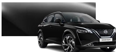
Czarny - Z11