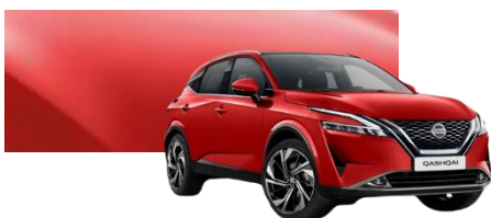
Czerwony - Z10