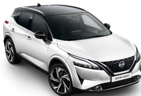
Biały perłowy + Czarny dach - XDF