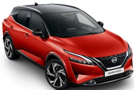
Czerwony Fuji Sunset + Czarny dach - XEY