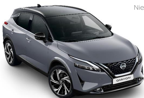
Szary ceramiczny + Czarny dach - XFU