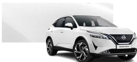
Biały - 326