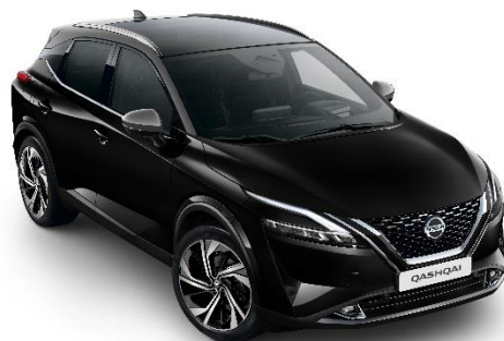
Czarny + Szary dach - XDK