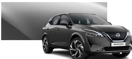
Szary - KAD