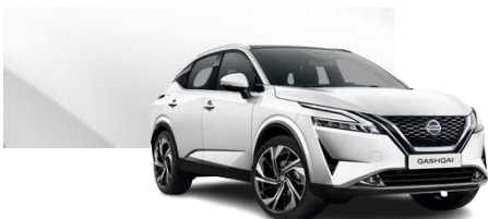
Biały perłowy - QAB