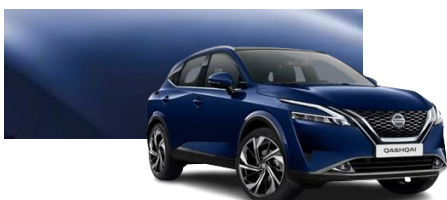
Granatowy - RBN