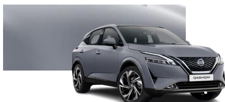
Szary ceramiczny - KBY