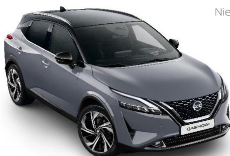
Szary ceramiczny + Czarny dach - XFU