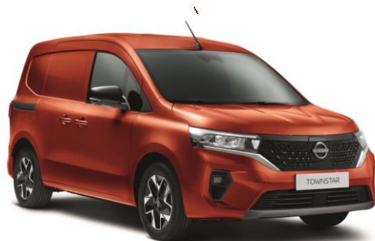
Pomarańczowy - CNZ