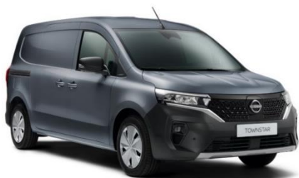
Ciemnoszary - KQR