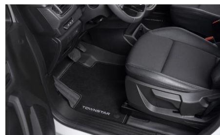
Welurowe dywaniki przednie 2 sztuki