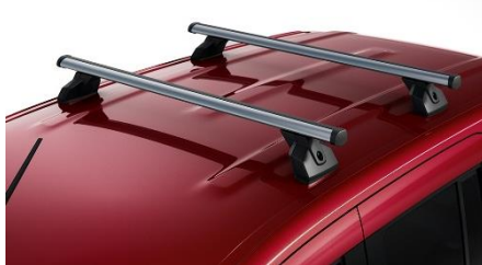
Belki dachowe Aluminium