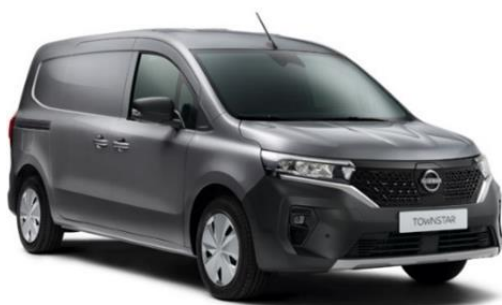
Szary Cassiopae - KNG