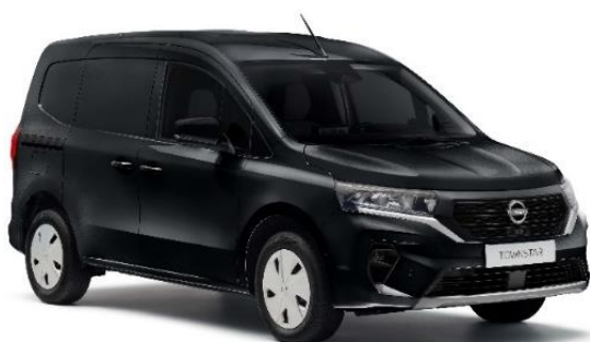
Czarny - GNE