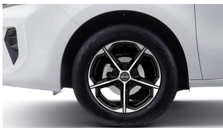
Felga aluminiowa 16"