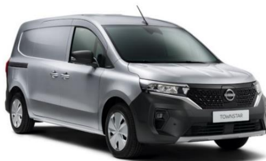
Szary Highland - KQA