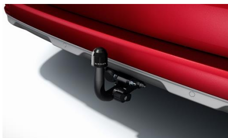
Hak holowniczy zdejmowany