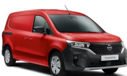
Czerwony - 719