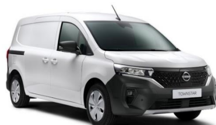
Biały - QNG