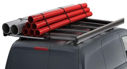
Bagażnik dachowy Aluminium