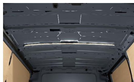
Lampy LED do przestrzeni ładunkowej