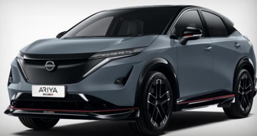
Szary STEALTH + czarny dach [YAZ]