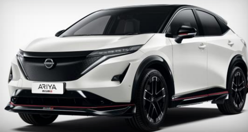
Biały perłowy + czarny dach [XGA]