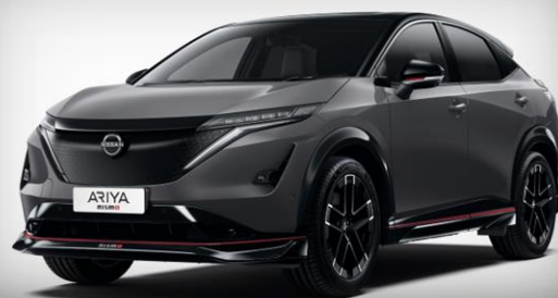
Szary metalizowany [KAD]