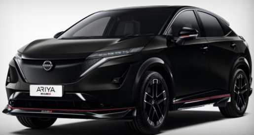
Czarny perłowy [GAT]