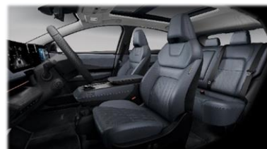
STANDARD EVOLVE+ / OPCJA EVOLVE: 10 000 zł: Niebiesko-szara [Z] (skóra Nappa + skóra ekologiczna**)