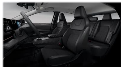
Czarna [G] (materiał + częściowo skóra ekologiczna**) – opcja z Pakietem KOMFORT