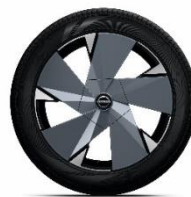
STANDRAD EVOLVE + OPCJA EVOVLE: 8 000 zł 20" felgi ze stopu metali lekkich z nakładkami aerodynamicznymi