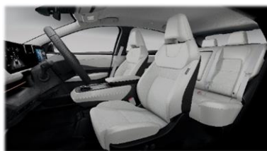
Kremowa [K] (materiał + częściowo skóra ekologiczna**)