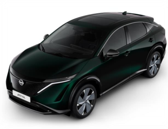
Zielony perłowy AURORA [DAP]