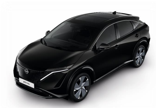
Czarny perłowy [GAT]

Lakier metalizowany / perłowy (jednokolorowe nadwozie) – 4 000 zł 1 (0 zł w przypadku cen promocyjnych 2023)