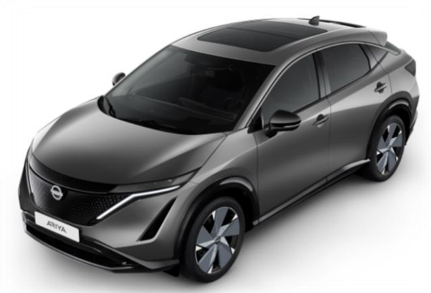
Szary metalizowany [KAD]