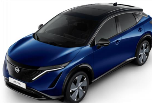
Niebieski perłowy + czarny dach i lusterka [XGU]