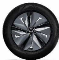
19" felgi ze stopu metali lekkich z nakładkami aerodynamicznymi