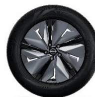
19" felgi ze stopu metali lekkich z nakładkami aerodynamicznymi (tylko EVOLVE)