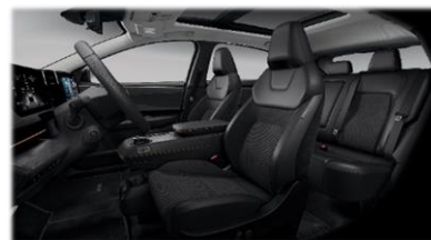
Czarna [G] tylko EVOLVE (welur perforowany + częściowo skóra ekologiczna**)