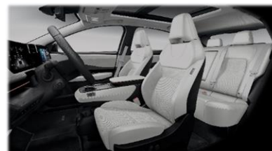
Kremowa [K] tylko EVOLVE (welur perforowany + częściowo skóra ekologiczna**)