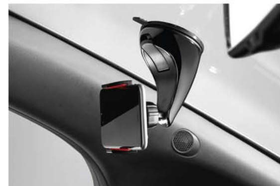
UCHWYT NA SMARTFONA, WIELOSTRONNY - CZARNY