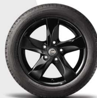
16" ELECTRON FELGI Z LEKKIEGO STOPU CZARNE (BZ11)