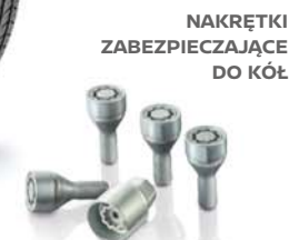
NAKRĘTKI ZABEZPIEZAJĄCE DO KÓŁ