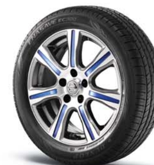
17" BOLD FELGI Z LEKKIEGO STOPU CIEMNOSZARE, ZE SZLIFEM DIAMENTOWYM I NIEBIESKIM PASEM