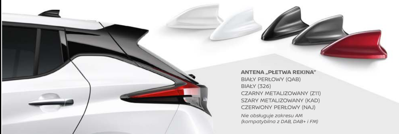
ANTENA „PŁETWA REKINA” BIAŁY PERŁOWY (QAB) BIAŁY (326) CZARNY METALIZOWANY (Z11) SZARY METALIZOWANY (KAD) CZERWONY PERŁOWY (NAJ) Nie obsługuje zakresu AM (kompatybilna z DAB, DAB+ i FM)