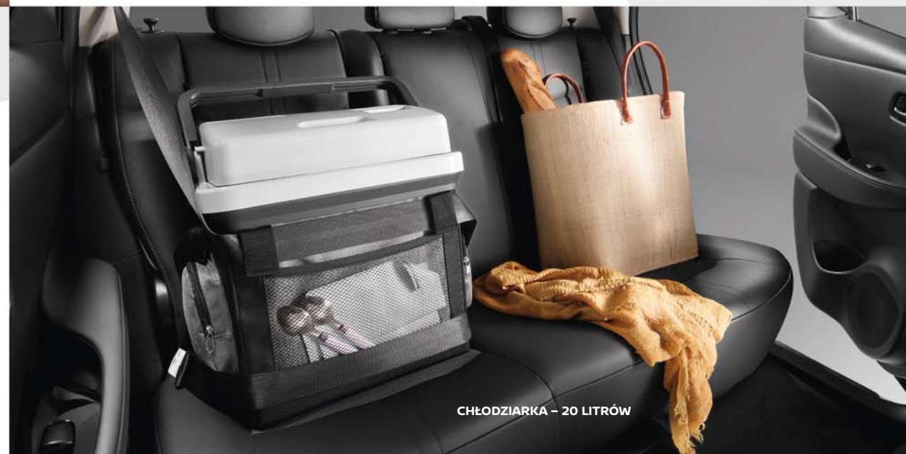
CHŁODZIARKA - 20 LITRÓW

Waga dziecka: do 13 kg, wiek dziecka: do 15 miesięcy.