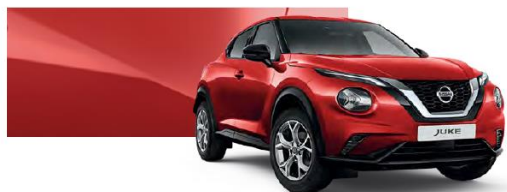
Czerwony - Z10