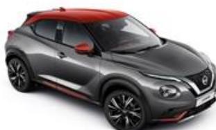
Szary + Czerwony Fuji Sunset dach - XFB Personalizacja wnętrza N-Design: B