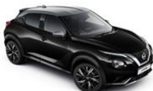
Czarny + Srebrny dach - XDZ Personalizacja wnętrza N-Design: B