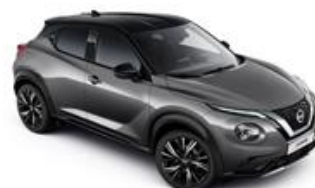
Szary + Czarny dach - XDJ Personalizacja wnętrza N-Design: W, B, R