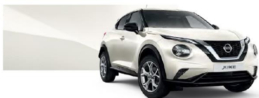
Biały perłowy - QAB