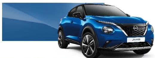
Niebieski - RCF