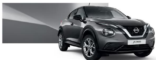
Szary - KAD

Lakier metalizowany / premium – 2.400 zł