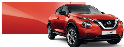
Czerwony Fuji Sunset - NBV