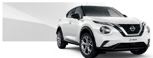
Biały - 326

Lakier metalizowany / premium – 2.400 zł