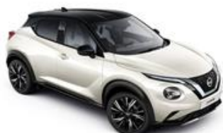
Biały perłowy + Czarny dach - XDF Personalizacja wnętrza N-Design: W, B

N-Design - Standard (kolor XEZ nie dostępny dla wersji wyposażenia N-Design)