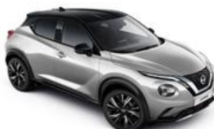
Srebrny + Czarny dach - XDR Personalizacja wnętrza N-Design: B