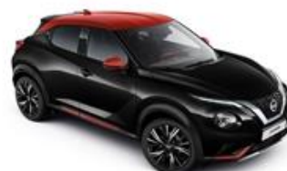
Czarny + Czerwony Fuji Sunset dach - XFC Personalizacja wnętrza N-Design: B, R