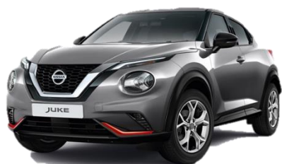
Miejski pakiet pomarańczowy