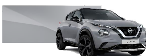
Szary ceramiczny - KBY