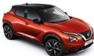
Czerwony Fuji Sunset + Czarny dach - XEY Personalizacja wnętrza N-Design: B