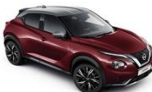
Burgundowy + Srebrny dach - XEE Personalizacja wnętrza N-Design: B