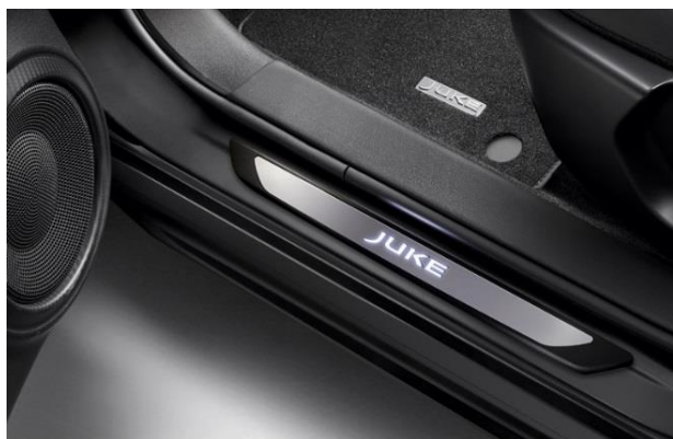
Podświetlane nakładki progów