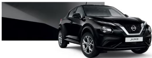
Czarny - Z11