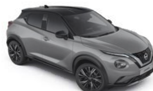
Szary ceramiczny + Czarny dach - XFU Personalizacja wnętrza N-Design: B

Dostępne 3 opcje personalizacji wnętrza dla wersji N-Design: