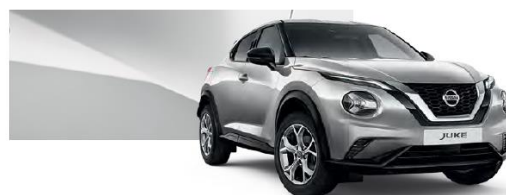
Srebrny - KYO