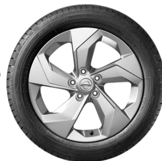
17" srebrna felga aluminiowa