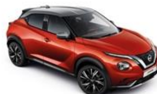
Czerwony Fuji Sunset + Srebrny dach - XEZ