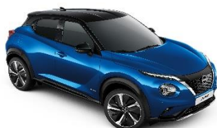
Niebieski + Czarny dach - XFV Personalizacja wnętrza N-Design: B