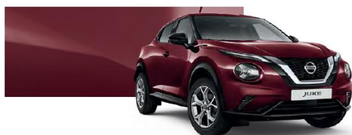
Burgundowy - NBQ